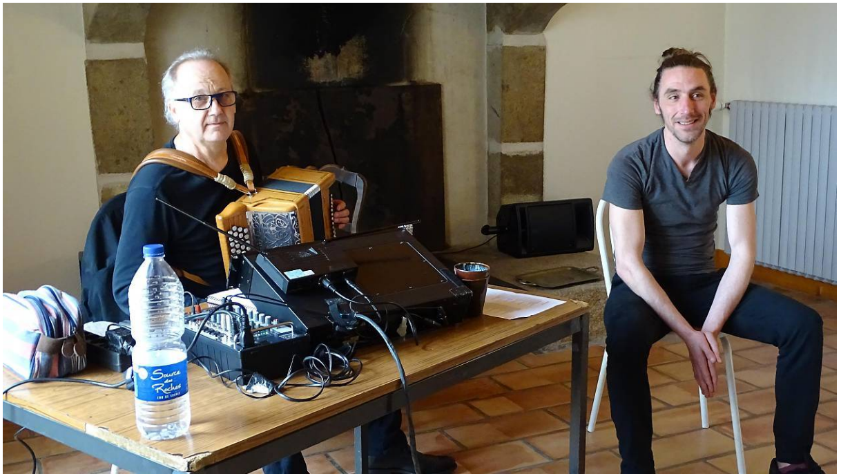
Ouest, France, 3 avril 2018